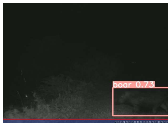
装置から約2mくらい離れた位置で検出