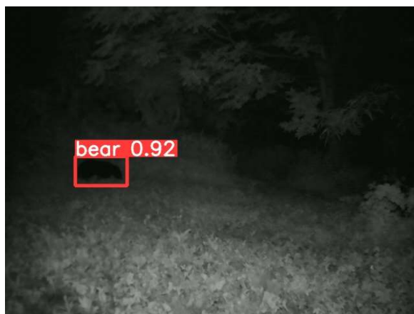
装置から約10mくらい離れた位置で検出