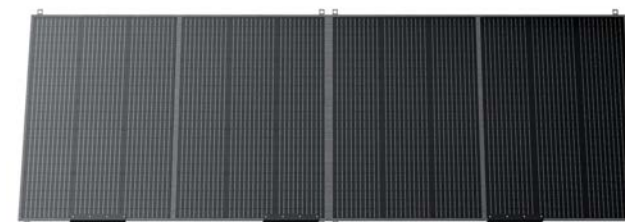
PV350S 定価 99,800円