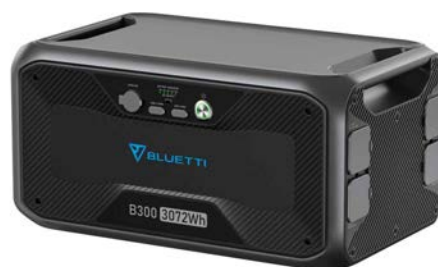
B300 定価 259,800円