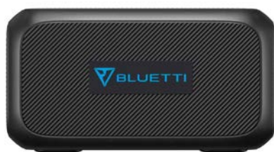
B230 定価 199,800円