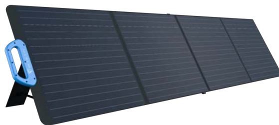
PV200 定価 59,980円