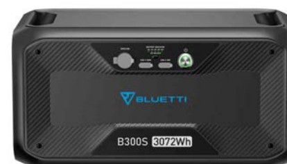
B300S 定価 319,800円